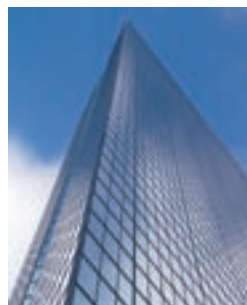
Climatisation/gestion de bâtiment